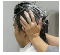
ヘッドスパ&シャンプー練習用ウィッグ 後頭部を揉粘法でシャンプー