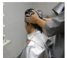
側頭部の洗髪技法

Cプラン 楽シャン君一式+出張講習費= 148,000円 (税込み・送料着払い)