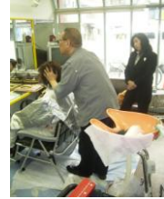
ヘッドスパの施術