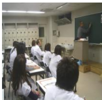
高齢者の洗髪に関する実技講習会（美容学校）