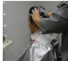
スタンドシャンプー